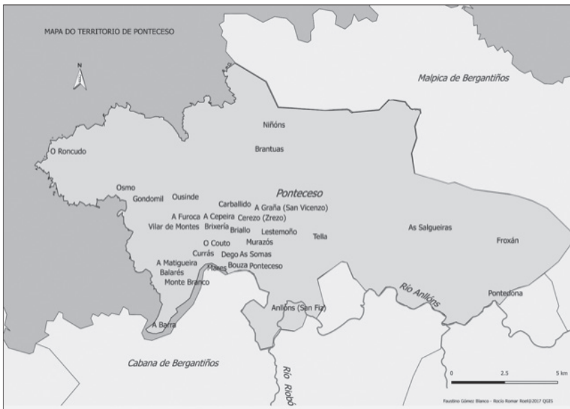
Mapa 1. Apéndice cartográfico de Rocío Romar Roel e Faustino Gómez Blanco; Ferreiro 2017a.

Naturalmente, o territorio estritamente pontecesán é o que conta con máis referencias na produción pondaliana. Eis un mapa do concello da Ponteceso cos